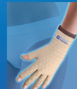
MOBIDERM® 3732 KOMPRESIVNÍ RUKAVIČKA S PRSTY