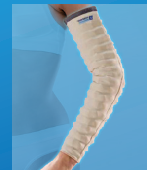
MOBIDERM® 3730 KOMPRESIVNÍ PAŇNÍ NÁVLEK

Kompresivní návleky MOBIDERM® slouží především pro stabilizaci redukce objemu lymfedému v období udržovací fáze léčby. Zdravotní pojišťovnou jsou hrazeny částečně.