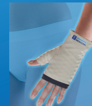
MOBIDERM® 3731 KOMPRESIVNÍ RUKAVIČKA BEZ PRSTŮ